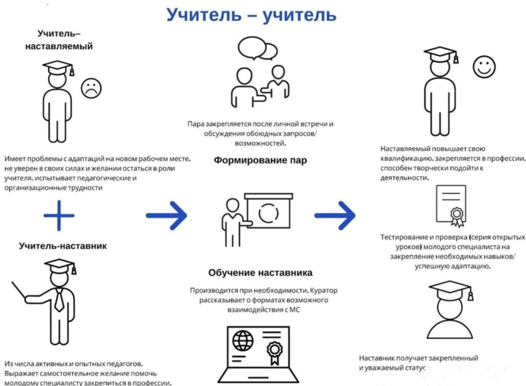
Рисунок 3. Графическое представление взаимодействия по форме «учитель-учитель»

– повышение заинтересованности в профессиональном росте и методической работе молодого специалиста совместно с опытным.